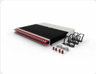
patchbox.one / 8RU / Cat6a