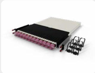
patchbox.one / 30RU / Fibra óptica