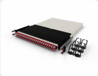
patchbox.one / 30RU / Cat6a